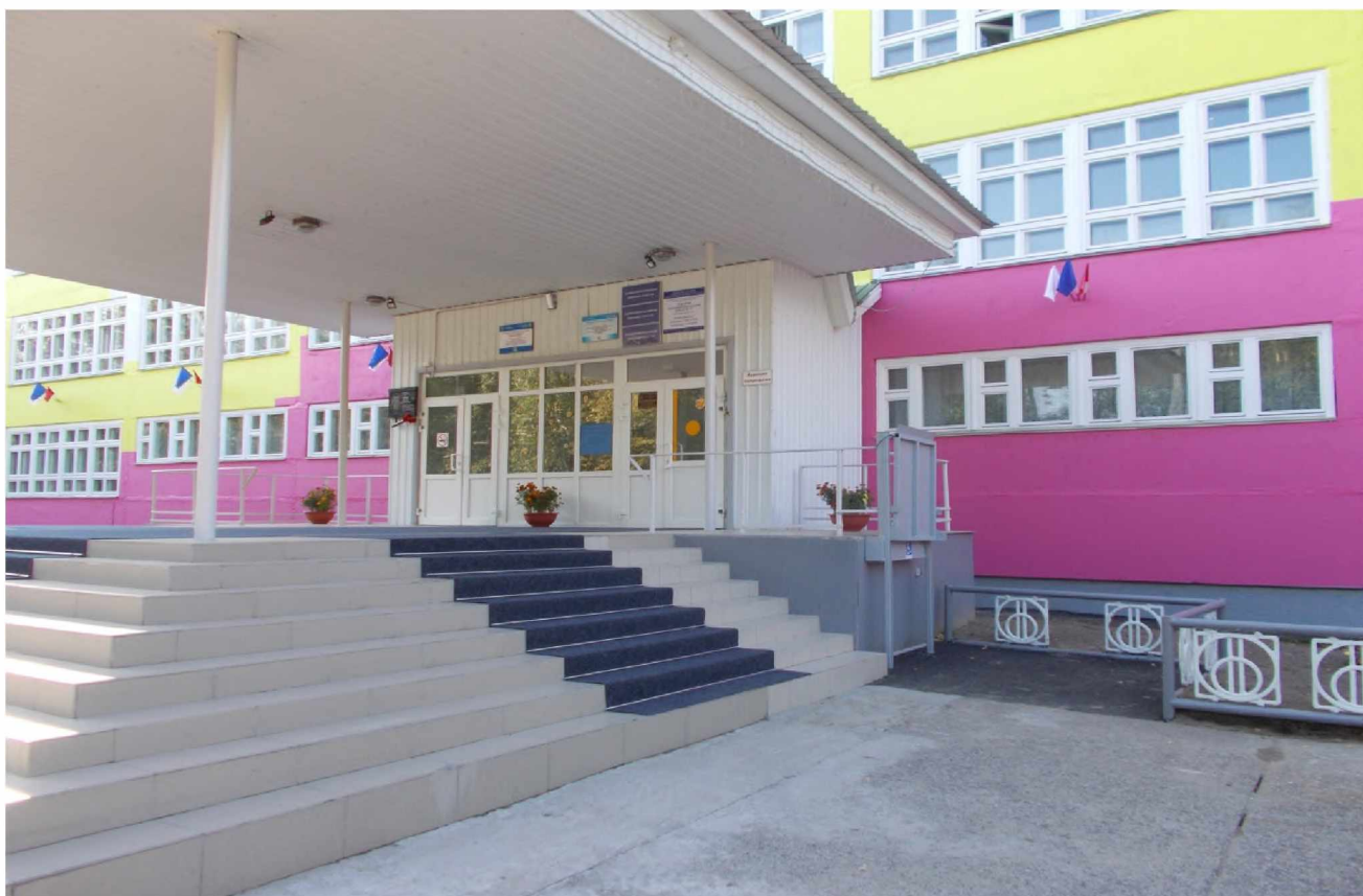
2. ЦЕНТРАЛЬНОЕ КРЫЛЬЦО СО СТОРОНЫ ПОДЪЕМНИКА ДЛЯ ИНВАЛИДНЫХ КОЛЯСОК