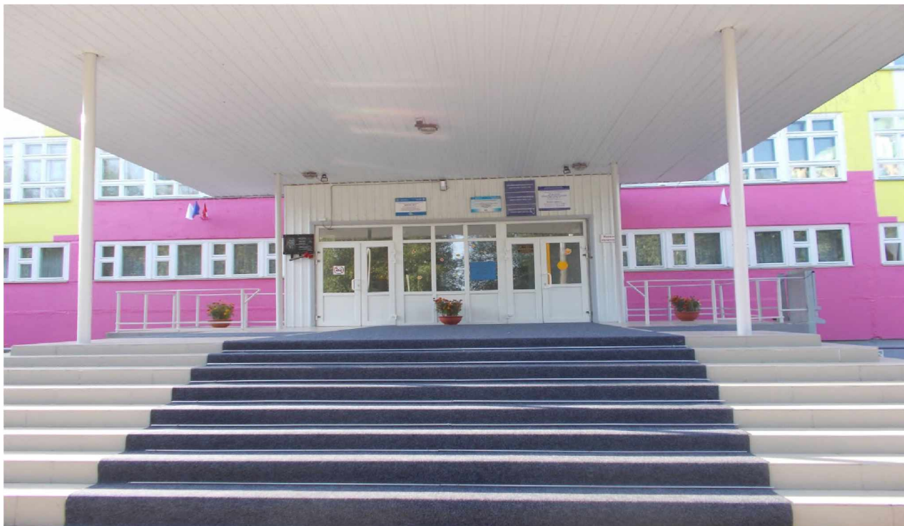
1. ЦЕНТРАЛЬНОЕ КРЫЛЬЦО