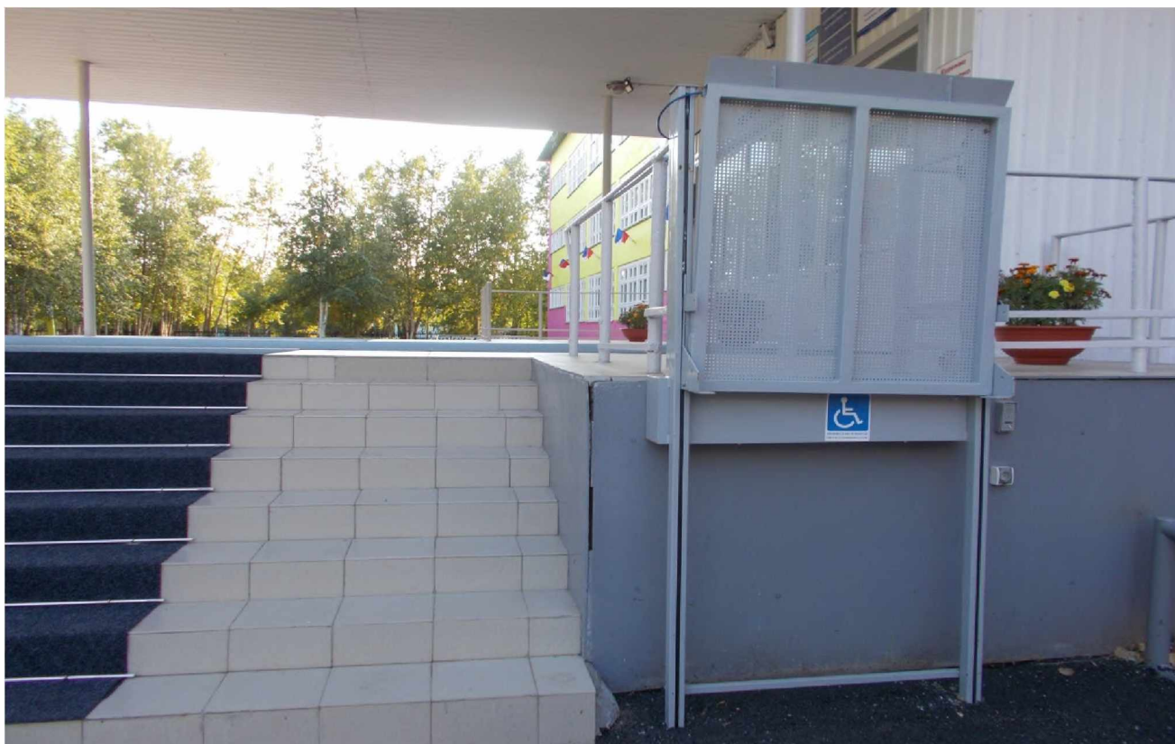
3. ПОДЪЕМНИК ДЛЯ ИНВАЛИДНЫХ КОЛЯСОК