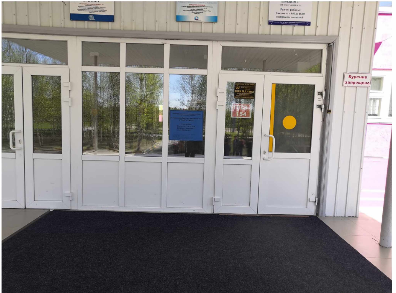
5. ВХОДНАЯ ГРУППА, ВХОД В ЗДАНИЕ